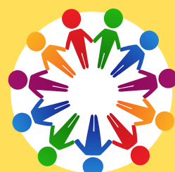
Imagen - Fotoperiodismo

La fotografía periodística ha jugado un papel importante en el registro de la historia de conflictos políticos, guerras, tragedias y confrontaciones.