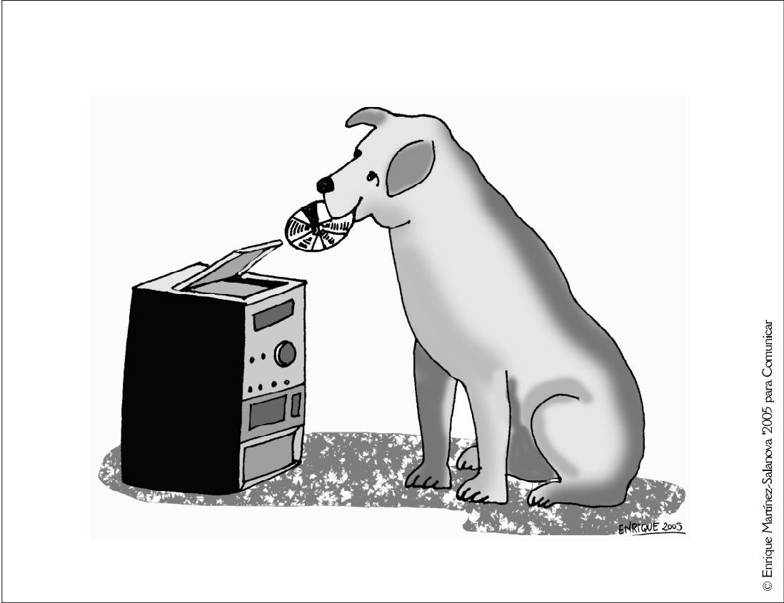
© Enrique Martínez-Salanova, 2005 para Comunicar