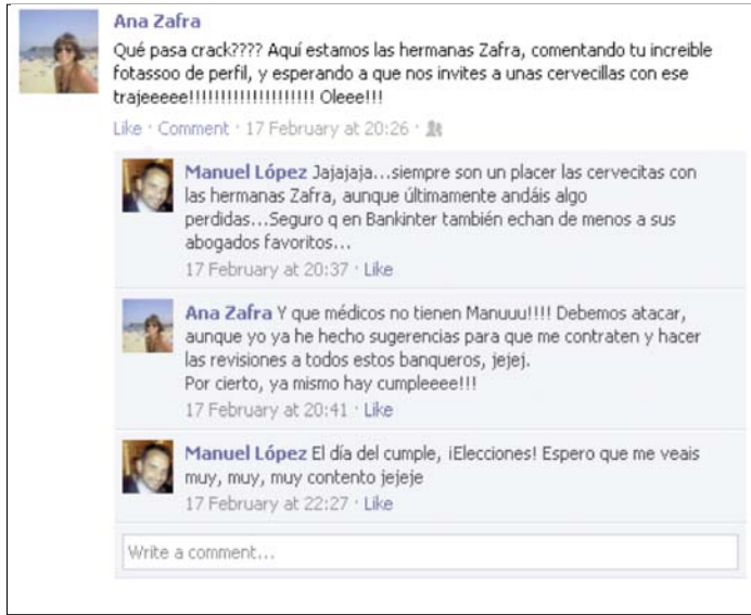
Imagen 2. Captura del muro del usuario estudiado en el caso 2.

hacen referencias a temas sociales presentes en la opinión pública. Como en el antiguo ágora, estamos en un espacio público que permite comunicarse sin trabas ni censura (Dahlberg, 2001: 617). La escasa participación del usuario 3 y el tono de sus comunicaciones están de acuerdo con el perfil: por un lado estos usuarios concentran su actividad en la red Tuenti; por otro, el lenguaje de los usuarios de esta edad suele ser pobre y lleno de incorrecciones. Estamos ante una comunicación escrita que está muy contaminada por las características de la oral (Yus, 2011). Por el resto de su actividad en el muro, apreciamos que ha utilizado la red para relacionarse (aceptación de amistad, catalogación de un perfil o colgar vídeos), más que para dialogar.