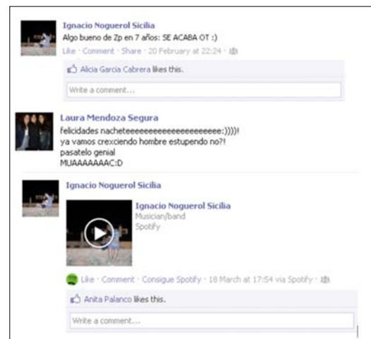
Imagen 3. Captura del muro del usuario estudiado en el caso 3.

En cuanto al pathos, la propia naturaleza de Facebook lo configura como el factor dominante de la red. El muro tiene una clara orientación hacia la empatía y la relación afectiva. Por eso se llama «amigos» (con toda la profundidad semántica del término) a