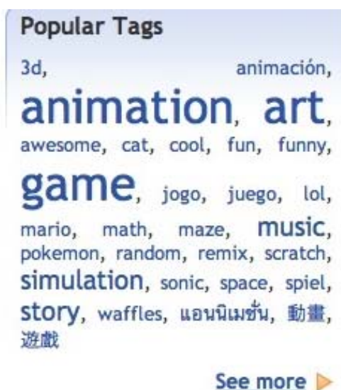
Imagen 2: Nube de etiquetas representando la participación internacional.

El variado número de usuarios que visualizan y cuelgan contenidos y sus países indica que se trata de un fenómeno internacional, y su nivel de aceptación evidencia el potencial que posee como herramienta transcultural para el uso creativo de la tecnología. Algunas características del sitio web han contribuido a su aceptación internacional. Es el caso de las versiones mexicana e israelí, especialmente adaptadas para los usuarios. Los creadores de «Scratch» en EEUU han establecido acuerdos con colaboradores para apoyar el desarrollo de la comunidad. Otro signo de la naturaleza internacional de «Scratch» es la aplicación que se muestra en la imagen 2, diseñada para informar de las palabras más populares para etiquetar proyectos, en varios idiomas.