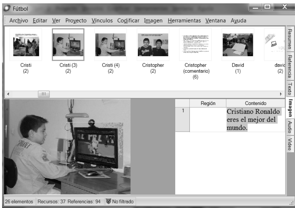
Imagen 2: Registros contenidos en un «nodo».

Para este proceso complejo propio de la etnografía se requiere de una herramienta lo suficientemente flexible y potente que ponga en relación registros de diferente naturaleza (textual, digital, audiovisual, imagen, sonido...). Fue a través de los «nodos» cómo NVivo nos permitió hacer esta tarea compleja. Según se evidencia en la Imagen 2, además de un entorno accesible para trabajar con los datos, esta herramienta permite crear grupos de significados complejos porque están contruidos por registros de distinta naturaleza, en diferentes momentos y por diferentes agentes.