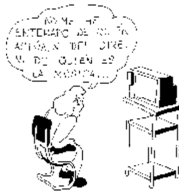
34. Derecho a ver las «pelis» enteras sin que corten los créditos por delante y por detrás.