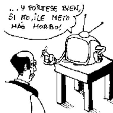
40. Derecho a defenderse del defensor del telespectador.