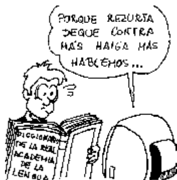
39. Derecho a mantener, respetar y mejorar nuestro idioma a pesar de los desmanes lingüísticos de los que hablan en la tele.