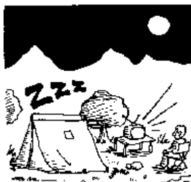
38. Derecho a dormir en los campings, a pesar de que la tele emita toda la noche.