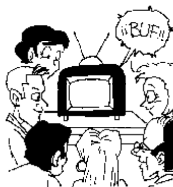
46. Derecho a tener un solo televisor en cada casa.