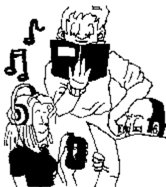
45. Derecho a vivir sin televisor.