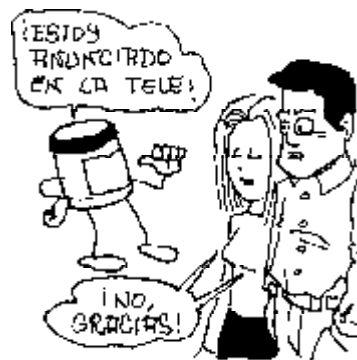
48. Derecho a no comprar productos «anunciados» por la tele.