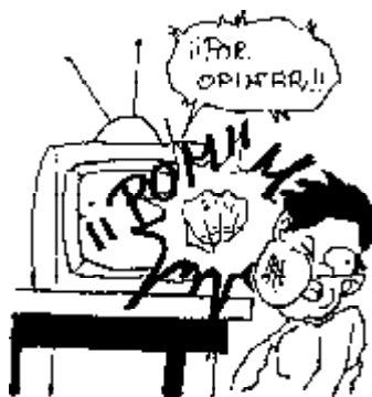
47. Derecho a interrelacionarse con la tele.