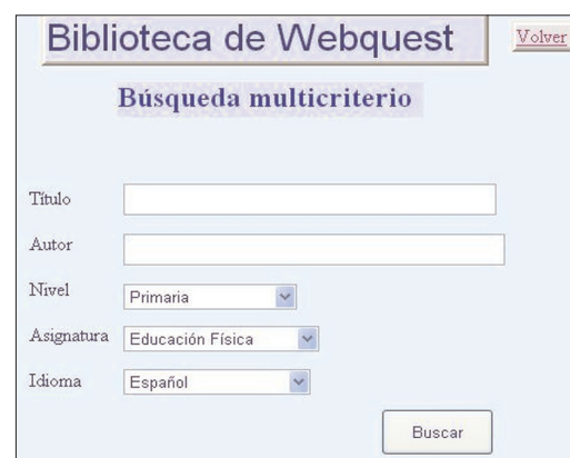
Figura 2. Búsqueda multicriterio.