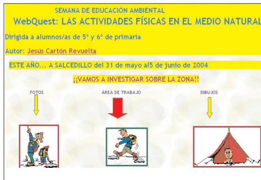
Figura 3. Objeto seleccionado.

ple por la asignatura (véase el gráfico de la página anterior), pero al recuperar el sistema webQuest de educación física de otros niveles educativos además del suyo, decide recurrir a la opción búsqueda avanzada, para especificar más criterios de búsqueda (véase el gráfico de la página anterior). El sistema devuelve metadatos, según los criterios especificados y decide cuál puede interesar, por lo que decide seleccionarlo. Se encuentra entonces con una página en la que además de poder acceder al webQuest, el objeto educativo que ha seleccionado tiene anotaciones que quizá le orienten y le proporcionen información adicional. Las anotaciones están realizadas por otros profesores, y en este caso son comentarios a dos de las secciones del webQuest en cuestión, que completan o refuerzan el planteamiento del autor de dicho webQuest. A la vista de las mismas, nuestro profesor se reafirma en su intención de acceder al webQuest y revisar, por ejemplo, las tareas que el autor propone.