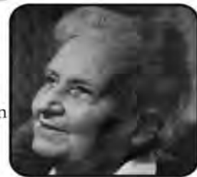
Maria Montessori, 1870-1952, educadora y doctora italiana Su método recibió mucho del Dr. Itard