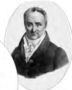
Philippe Pinel (1745-1826)

Fundador ideológico de la psiquiatría científica