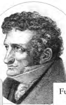
Jean-Marc-Gaspard Itard 1774-1838 médico, padre de la otorrinolaringología