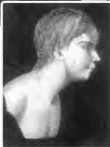
Victor de l'Aveyron era probablemente autista

Pinel declaró al niño incurable pero Itard se ocupó de él de 1801 a 1806