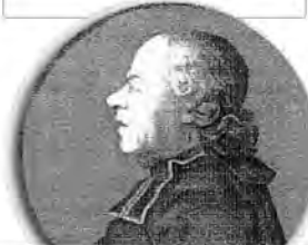
L'abbé Charles Michel de l'Épée 1712-1789

Fundador ideológico de la psiquiatría científica