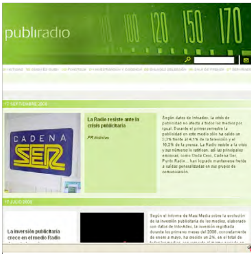
Publiradio.net ( www.publiradio.net ) (24-09-08).

Al estudiante se le ofrece la posibilidad de interactuar con un instrumento que le va a permitir, por ejemplo, seleccionar, escuchar, descargar y manipular un elemento sonoro para la elaboración de una cuña de 30 segundos, visitar los principales estudios de sonido, repasar una lección, analizar las voces más significativas de la publicidad radiofónica española, escuchar piezas publicitarias históricas, o conocer las investigaciones más recientes sobre publicidad radiofónica.