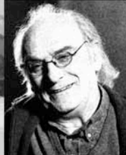
CARLOS SAURA (1932)

EL CINE SE CONVERTÍA EN LA CONCIENCIA DE EUROPA