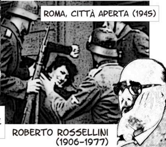
ROBERTO ROSSELLINI (1906-1977)