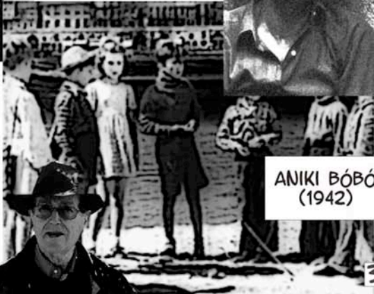
ANIKI BÓBÓ (1942)