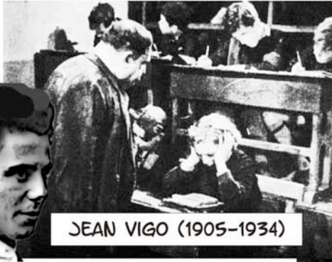
JEAN VIGO (1905-1934)