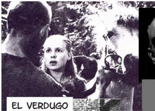
EL VERDUGO (1963)