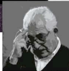
JUAN ANTONIO BARDEM (1922-2002)