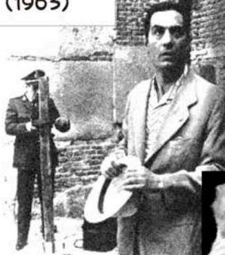
LUIS GARCÍA-BERLANGA (1921)