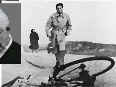
MUERTE DE UN CICLISTA (1955)