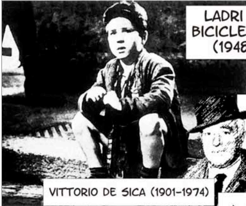
VITTORIO DE SICA (1901-1974)