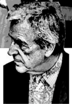
VITTORIO (1929) Y PAOLO TAVIANI (1931)