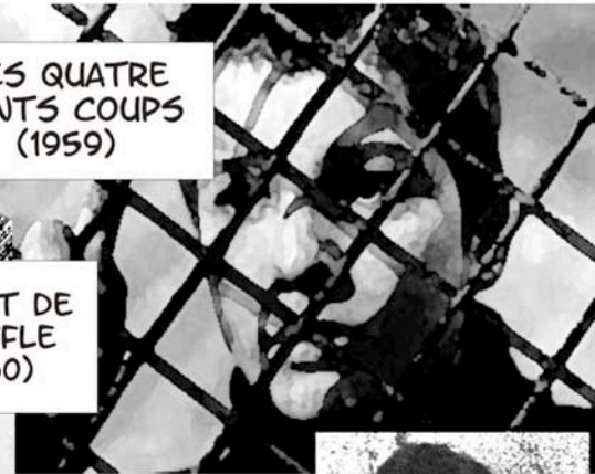
À BOUT DE SOUFFLE (1960)