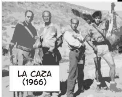
LA CAZA (1966)