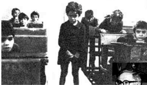
PADRE PADRONE (1977)