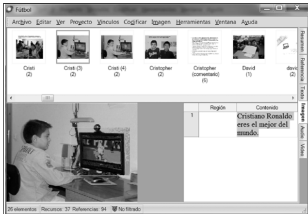
Imagen 2: Registros contenidos en un «nodo».

posible comprender progresivamente cómo se establecían las relaciones interculturales y su contenido. Y, como en el caso del balompié, estos agrupamientos nos permitieron ir ratificando que tras la afición a ese deporte se definió un universo de significados y prácticas muy diversas que dieron sentido a las relaciones entre el alumnado, y que mostraron quiénes eran los niños y niñas que habitaban las aulas. NVivo nos permitió un nivel de registro intersubjetivo de descripción detallada y explicación contrastada sobre cómo nues-