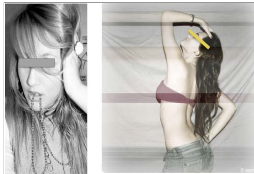
Imagen 4: Tacto femenino.

En algún caso, las fotos de besos con amigas aparecen después de empezar una relación heterosexual y, en otros, parece haber un cuestionamiento de un modelo de masculinidad que se percibe como agresivo. Los comentarios realizados por las amigas, además de las fotos y los textos, refuerzan también esta idea cuando definen a este tipo de chicos como «monstruos» o comentan que ya no se lleva enamorarse «del