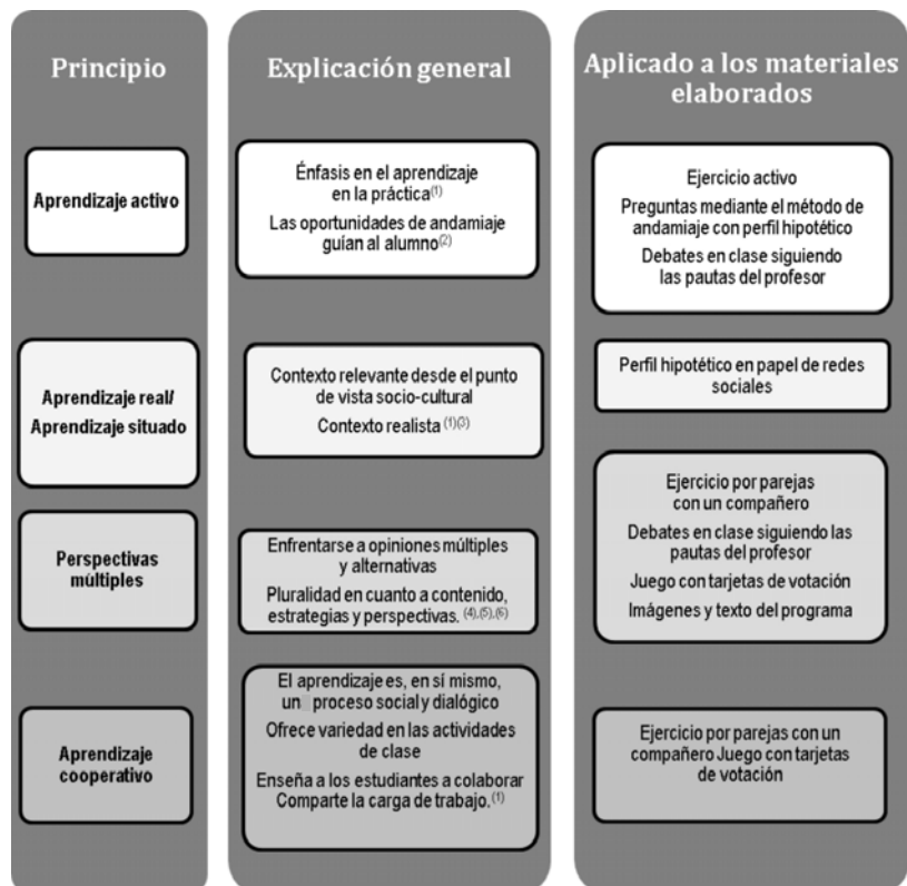
Gráfico 1. Pautas de aprendizaje derivadas del constructivismo y cómo se aplican en los materiales elaborados.

2) Ejercicio por parejas. Los estudiantes reciben un ejemplo de perfil de red social hipotética de alto riesgo sobre papel y tienen que contestar las preguntas sobre este perfil junto con un compañero. Las preguntas eran distintas para los tres diferentes paquetes, guiando a los alumnos (andamiaje) hacia los diferentes riesgos existentes en el perfil. Como ejemplo, el curso sobre riesgos de contacto contiene la pregunta: «¿Ob-