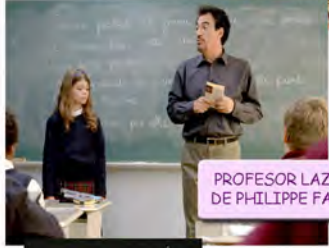
PROFESOR LAZHAR, 2011 DE PHILIPPE FALARDEAU