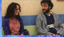
UN NOVIO PARA YASMINA 2008 DE IRENE CARDONA BACAS