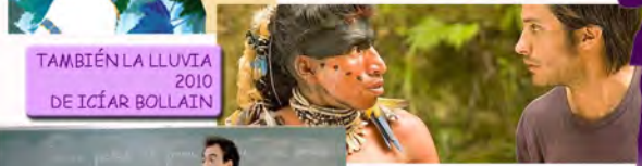
TAMBIÉN LA LLUVIA 2010 DE ICIAR BOLLAIN