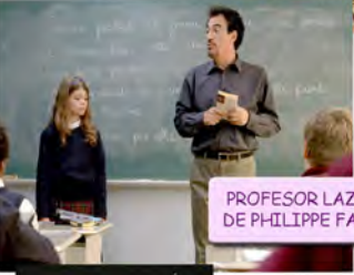
PROFESOR LAZHAR, 2011 DE PHILIPPE FALARDEAU