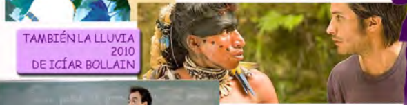
TAMBIÉN LA LLUVIA 2010 DE ICÍAR BOLLAIN