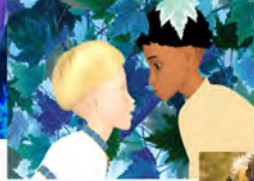
AZUR Y ASMAR 2004 DE MICHEL OCELOT