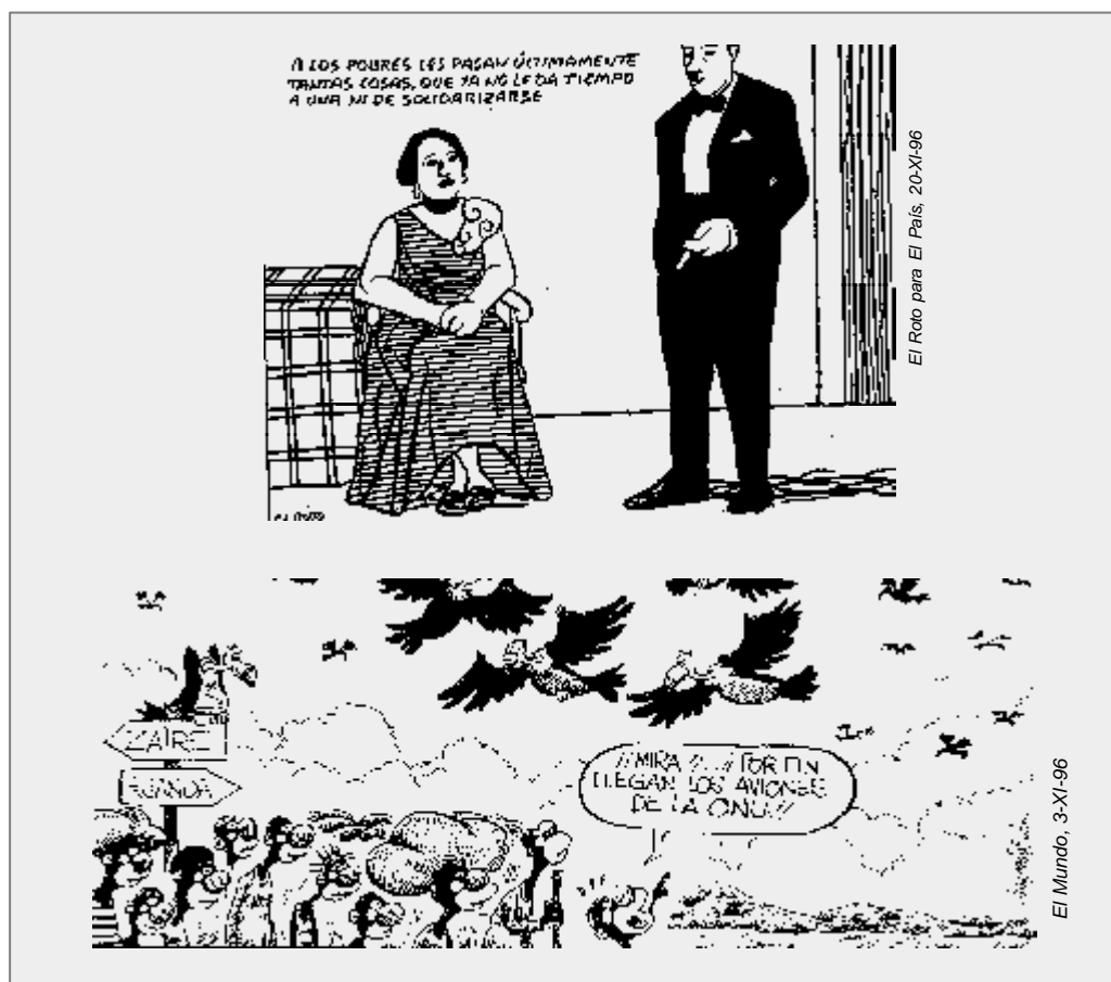
Selección de algunas tiras cómicas sobre solidaridad, recogidas en la prensa.

1. Una herramienta útil son los «chistes»: reflejan, con frecuencia, una crítica acerca de la sociedad insolidaria y que los alumnos pueden aprender a descubrir y criticar. Así, la tragedia del Zaire ha generado muchos chistes en la prensa que tienen una gran crueldad en la denuncia de la situación, como podemos observar en las tiras cómicas que adjuntamos.