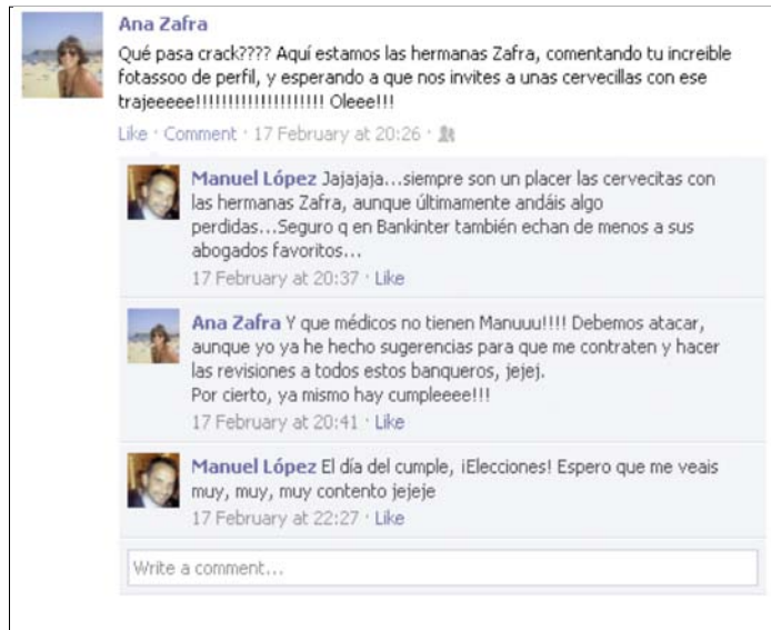
Imagen 2. Captura del muro del usuario estudiado en el caso 2.

hacen referencias a temas sociales presentes en la opinión pública. Como en el antiguo ágora, estamos en un espacio público que permite comunicarse sin trabas ni censura (Dahlberg, 2001: 617). La escasa participación del usuario 3 y el tono de sus comunicaciones están de acuerdo con el perfil: por un lado estos usuarios concentran su actividad en la red Tuenti; por otro, el lenguaje de los usuarios de esta edad suele ser pobre y lleno de incorrecciones. Estamos ante una comunicación escrita que está muy contaminada por las características de la oral (Yus, 2011). Por el resto de su actividad en el muro, apreciamos que ha utilizado la red para relacionarse (aceptación de amistad, catalogación de un perfil o colgar vídeos), más que para dialogar.