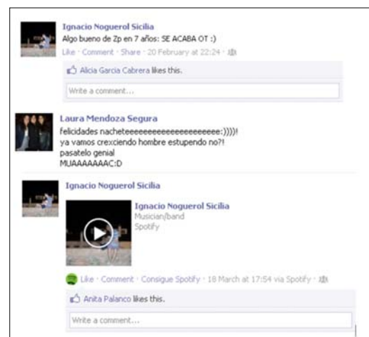
Imagen 3. Captura del muro del usuario estudiado en el caso 3.

En cuanto al pathos, la propia naturaleza de Facebook lo configura como el factor dominante de la red. El muro tiene una clara orientación hacia la empatía y la relación afectiva. Por eso se llama «amigos» (con toda la profundidad semántica del término) a