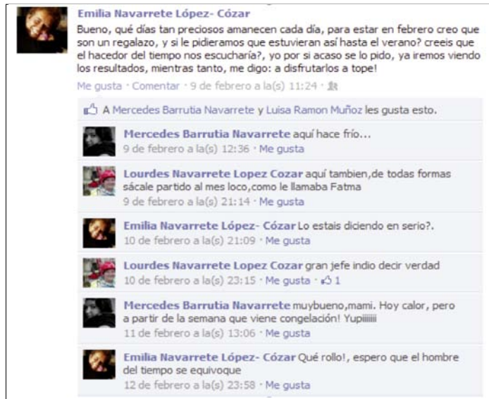
Imagen 1. Captura del muro del usuario estudiado en el caso 1.

Se puede decir que cada uno de los usuarios analizados ha usado su red con fines persuasivos, no solo para «compartir la vida» sino con la intención de motivar cierta respuesta entre sus amigos-familiares-usuarios de esa misma red, intención en la que se puede vislumbrar cierto grado de persuasión. Para ello han recurrido a diversas estrategias retóricas, de una forma muy particular y frecuente al uso de figuras retóricas. Sirva de ejemplo el fragmento de muro que se muestra a continuación, en pocas líneas utiliza abundantes figuras: metáfora, interrogación retórica, sinécdoque,